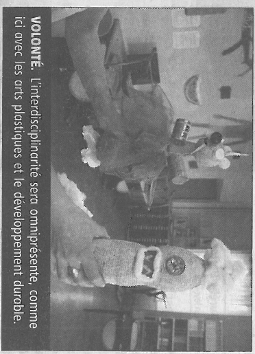
VOLONTÉ. L'interdisciplinarité sera omniprésente, comme ici avec les arts plastiques et le développement durable.

Mise en place d'une formation scientifique à la rentrée 2017